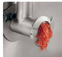
孔径 4.5mm 的刀盘