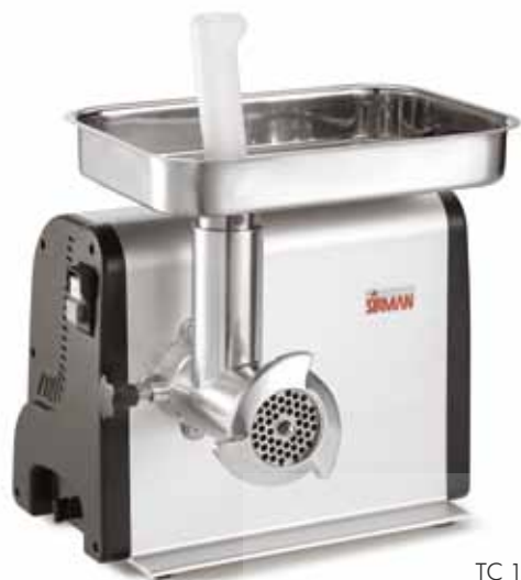
TC 12 DENVER