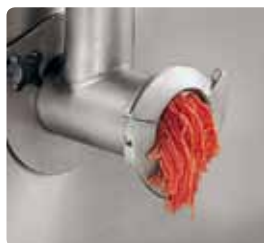
孔径 3mm 的刀盘