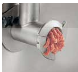
孔径 8mm 的刀盘